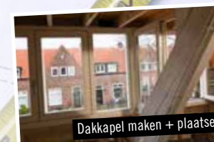
Dakkapel maken + plaatsen

Radek Legal heeft een top verzekeringspakket. Onverhoopte ongevallen zijn altijd volledig gedekt.